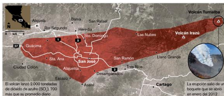
Figura 3. Mapa de influencia de ceniza en el Valle Central, Costa Rica.

Diseño de problemas y tareas matemáticas según el currículo de matemáticas costarricense.