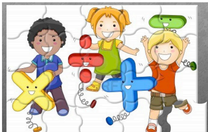
Figura 2. Rompecabezas.

Actividad C. Resolución de problemas. Se presentan problemas enfocados a contextos reales para resolver en grupos de tres o cuatro personas. Con esta actividad se activan varios procesos: