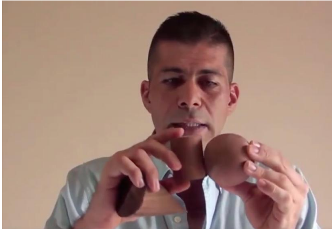
Figura 2. El facilitador, en el video, introduce el tema que se va a tratar.

La actividad 1 del módulo 4, del curso PGB, sobre visualización espacial se denomina Galletas con cubierta de chocolate . El facilitador introduce el tema mencionando que se trata de visualizar propiedades de las figuras en el espacio tridimensional. La figura 2 es una captura de pantalla de esta parte del video.